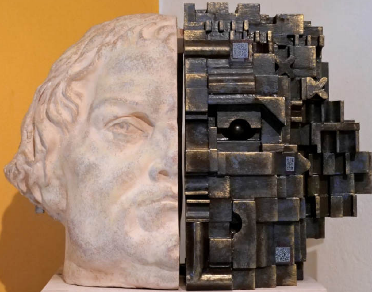
YAROSLAV KURBANOV „VERBINDUNG“, 2017